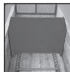
Sponda per avanzamento sulla catena